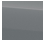
KOLOR LAKIERU: Galactic Gray (ZCD)